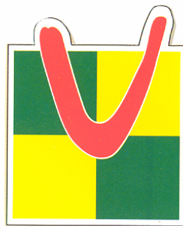
Mancomunitat de la Valldigna